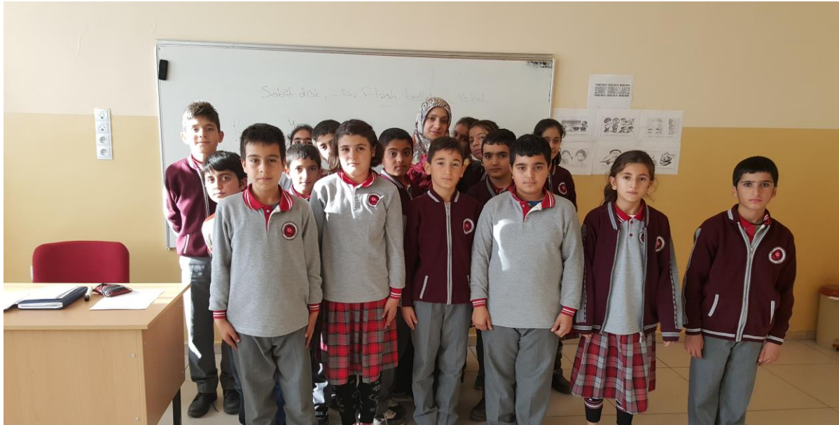
Tablo 13. 2015 Yılı Kurumdaki Öğretmen Sayısı: